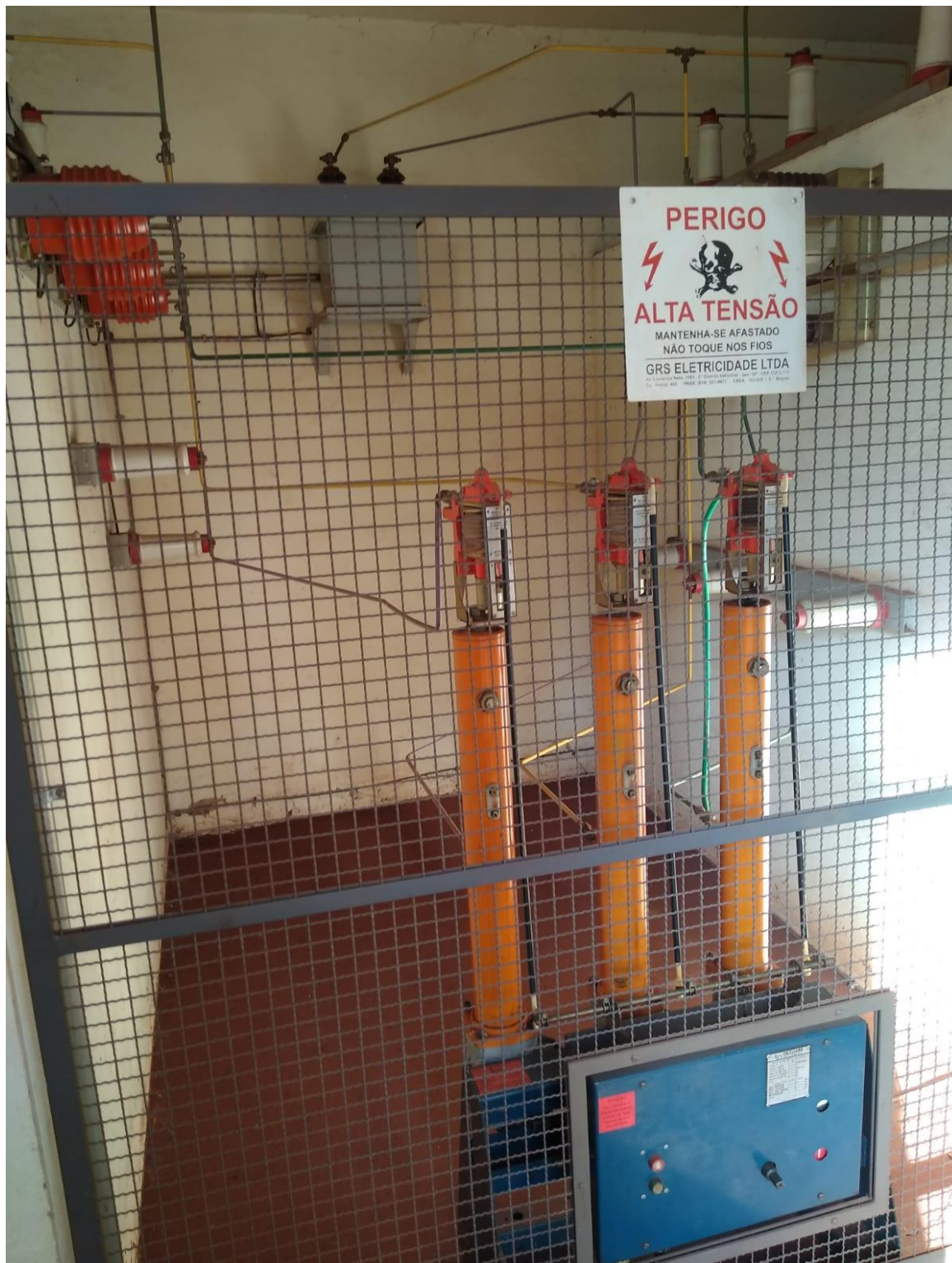
Anexo Fotográfico 01