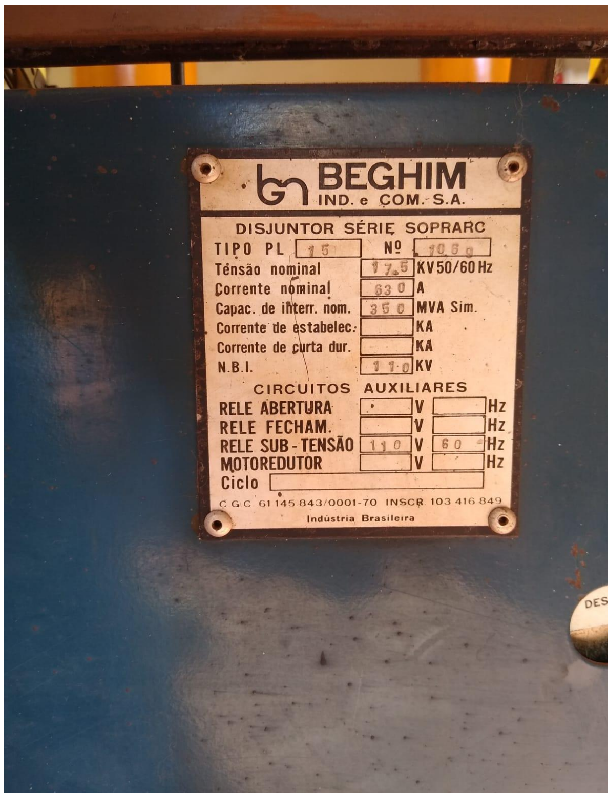
Anexo Fotográfico 03